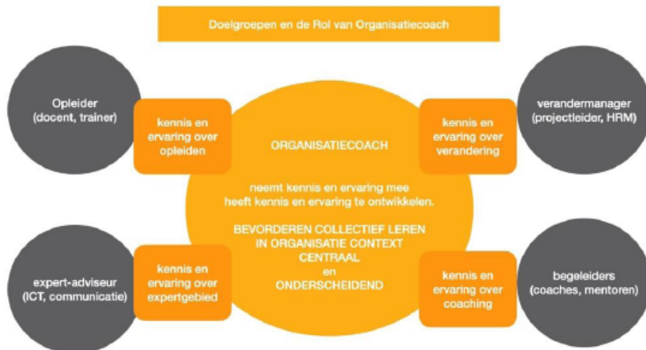
Figuur 1: De samenhang tussen de doelgroepen en de rol van de Organisatiecoach (Model THGS: opleiding Master Organisatiecoaching)